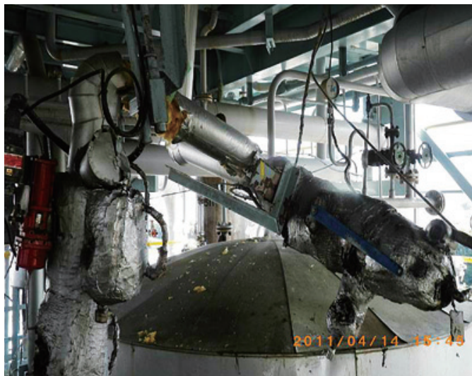
図6 ベッセル上部配管の脱落